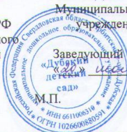
График работы сотрудников МДОУ «Дубский детский сад»